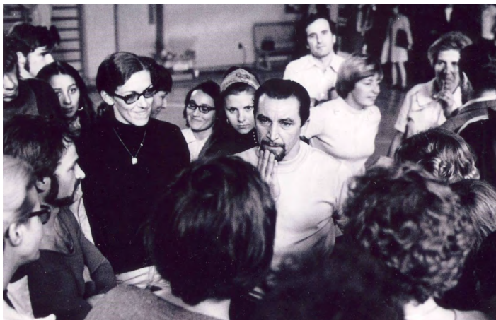
La venue de Maurice Béjart au Département de kinanthropologie. Lieu : gymnase du pavillon Lafontaine.