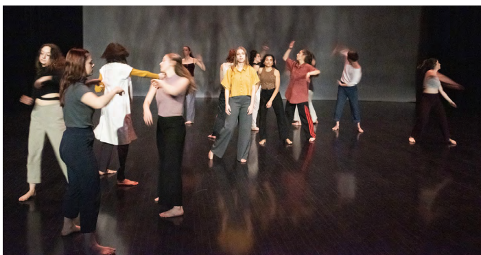
Département de danse, UQAM

Durant cette décennie, je ne saurais plus dire exactement qui a fait quoi tant le département fourmille d'initiatives diverses. Outre la mise sur pied de nouveaux cours impulsant leur perfectionnement personnel et leur futur champ de recherche, les professeures et professeurs vont ponctuer ce cycle de réalisations structurantes, tant à l'interne que dans le milieu professionnel : cofondation de Artscène , groupe départemental de recherche-création qui produira plusieurs œuvres dans les