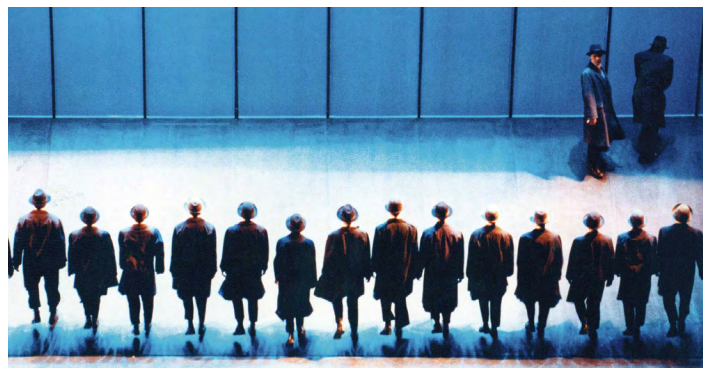
Joe, chorégraphie de Jean-Pierre Perreault, créée en 1983 pour/avec 24 étudiantes et étudiants du baccalauréat en danse, œuvre "culte" qui a fait l'objet de plusieurs documentaires et a été reprise à travers le monde.