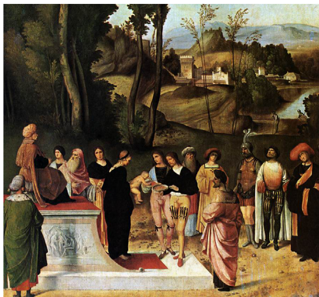
Giorgione, Moïse enfant subit l'épreuve du feu (circa 1505). Galerie des Uffizi, Florence.

Voilà pourquoi il importe de nous demander si le don de mort, tout requis soit-il, tout emmaillé soit-il dans le droit fil de l'institution sociétale du droit, ne serait pas un