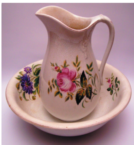
Broc et cuvette, fleurs peintes à la main sous glaçure, estampille de la St. John's Stone Chinaware Co. de la période 1877-1893.