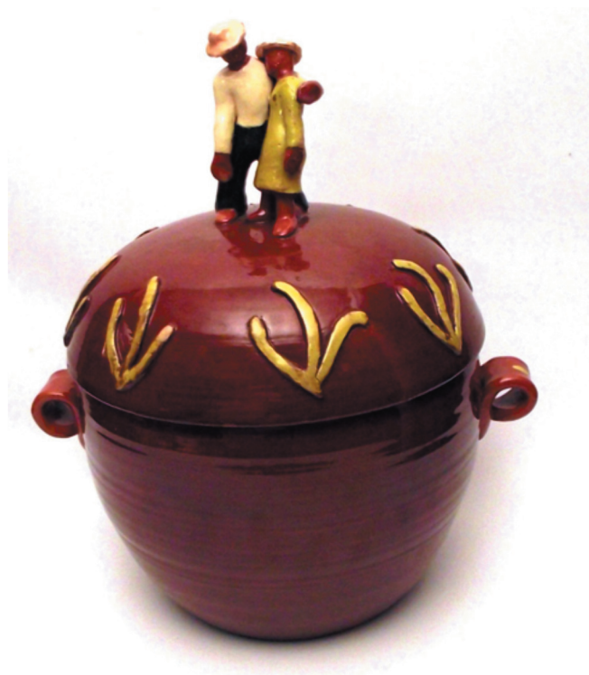
Soupière gigantesque, avec couvercle à personnages. Faïence de Gaëtan Beaudin, La Faïencerie d'art, Montréal, 1945.