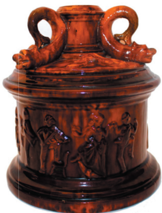
Pot à tabac des Dion, terre cuite rouge, glaçure marbrée à base de manganèse, décor avec danseurs, musiciens et serpents de mer, couvercle avec réceptacle pour allumettes.

La collection devient chez nous une passion captivante, une maîtresse exigeante. Devant la difficulté grandissante de trouver sur le marché des pièces du