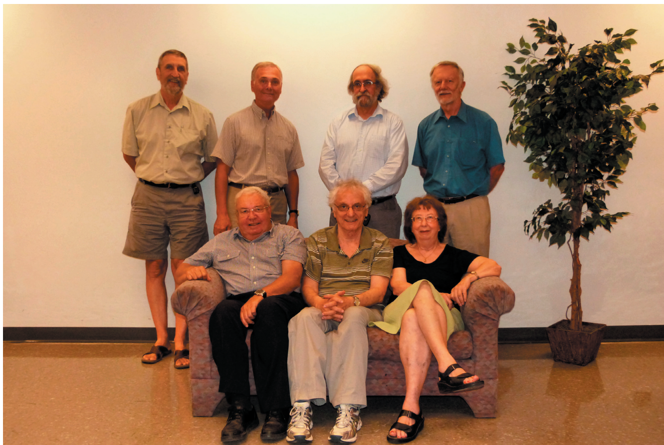
Photo du conseil d'administration, 2013-2014