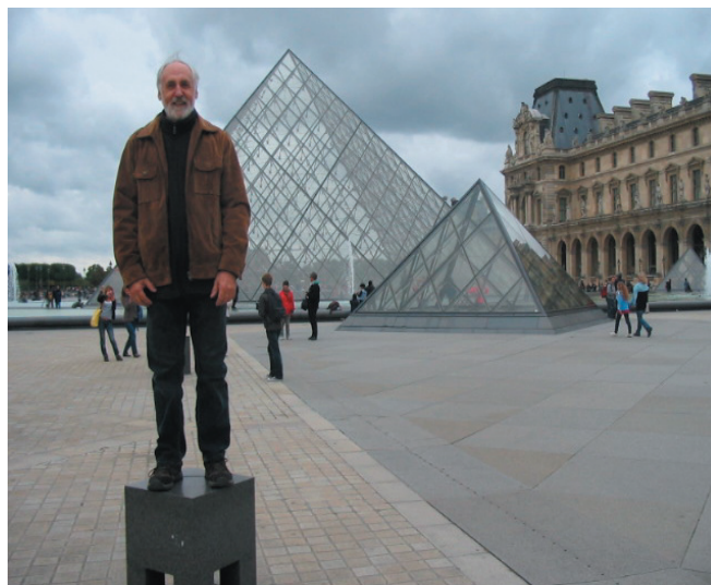
Il manque une statue au Louvre. La voici...

La faim nous tenaillait. On a jeté un coup d'œil sur notre montre : il a fallu deux heures 15 pour faire les 18 minutes de la route officielle prévue. Et pourtant, on n'a fait que se presser tout le temps. Google Maps n'est pas curieux : c'est pourtant une qualité essentielle pour déterminer la durée d'un itinéraire.