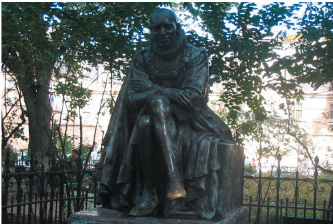
Montaigne pensif et penseur devant la Sorbonne de monsieur Sorbon

Mesdames, le noir est à l'honneur. Le noir sous toutes ses nuances. Le maquillage ne doit plus être naturel mais accentué et foncé. Messieurs, les chemises sont en vente, sur mesure à 180 $. Quoi ? Vous portez encore du prêt-à-porter ? Quelle honte !